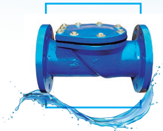
VAL. CHECK PARA DESAGÜE