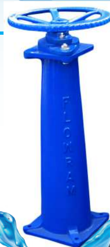
PEDESTAL DE MANIOBRA