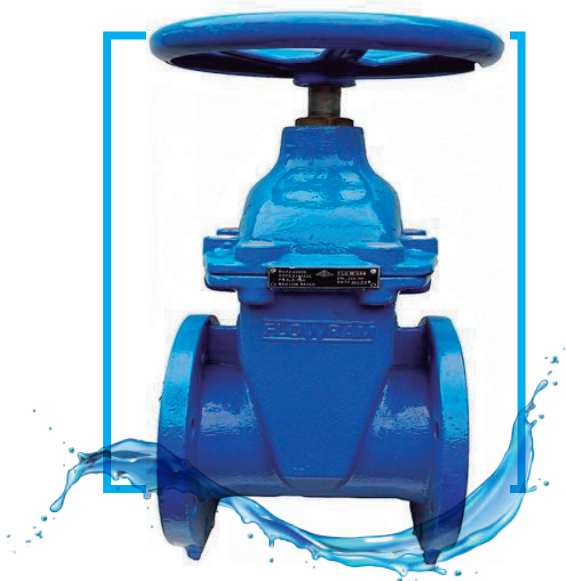
VAL. COMPUERTA BRIDADA