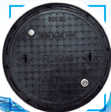
TAPA DE BUZÓN