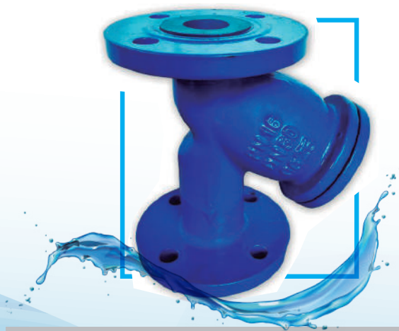
FILTRO TIPO Y