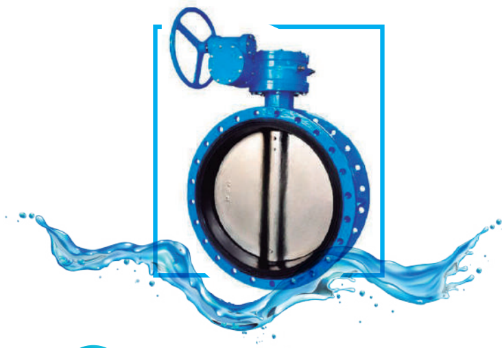
VAL. MARIPOSA BRIDADA