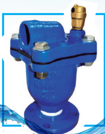
VAL. AIRE TRIPLE FUNSIÓN