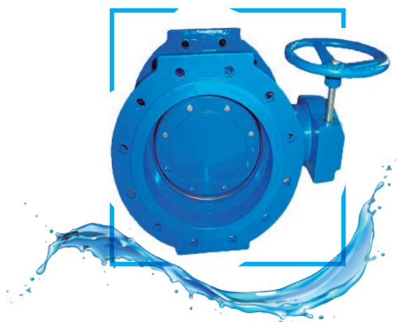
VAL. MARIPOSA EXCENTRICA