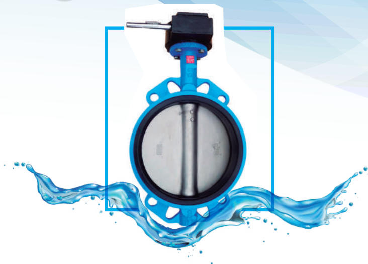
VAL. MARIPOSA WAFER