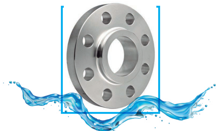
BRIDA SLIP ON