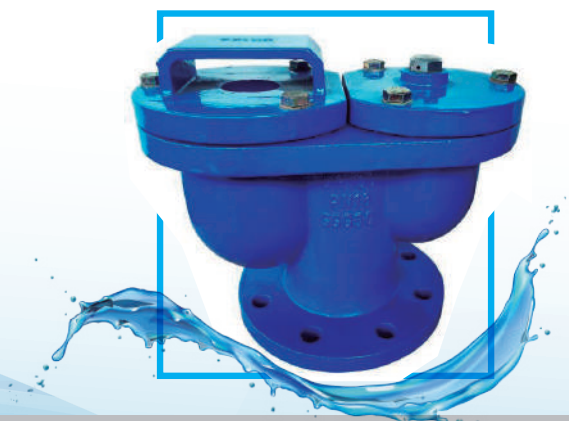
VAL. AIRE DOBLE ESFERA